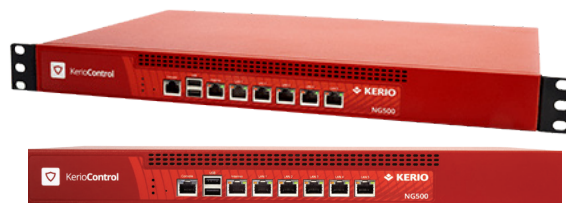
NG 510 e NG 511